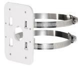
PFA152 Dispositif de montage sur mât