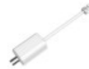
LR1002 Convertisseur ePoE sur câble coaxial